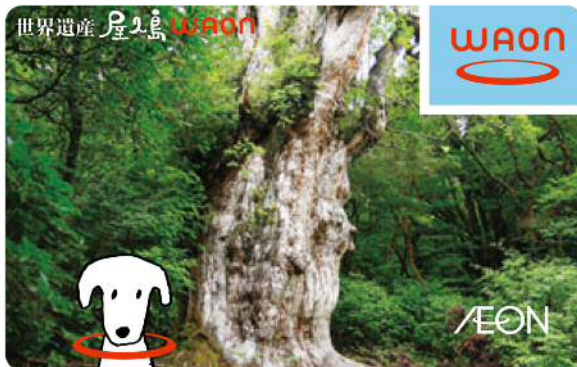
世界遺産 屋久島WAON2011年9月発行