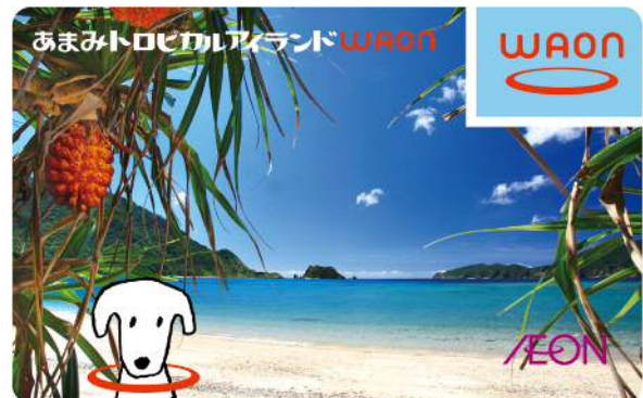
あまみトロピカルアイランドWAON2014年12月発行