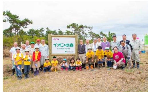
2017年 福島県いわき市植樹