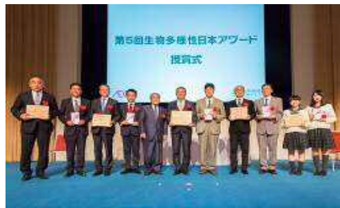
第5回「生物多様性日本アワード」受賞式(国連大学)

生物多様性の保全と持続可能な利用の推進を目的として、「生物多様性みどり賞 (国際賞)」と「生物多様性日本アワード (国内賞)」の2つのアワードを創設し、隔年で顕著な環境保全活動が認められる個人・団体を顕彰しています。2016年度は第4回「生物多様性みどり賞 (国際賞)」を実施し、2017年度は第5回「生物多様性日本アワード (国内賞)」を実施しました。