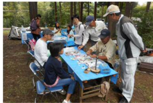
NPO法人しろい環境塾ドングリ工作 (千葉)

1991年より26年間「生物多様性の保全と持続可能な利用」のため、国内外の地域において、積極的に環境保全活動を継続している団体への助成支援を行っています。2016年度は、植樹、森林整備、砂漠化防止、里地・里山・里海の保全、湖沼・河川の浄化、野生生物の保護、絶滅危惧生物の保護などを行う団体99件に、9,797万円の助成を行いました。累計では2,744件、総額24億9,700万円となりました。2017年も継続して環境活動への助成を実施します。