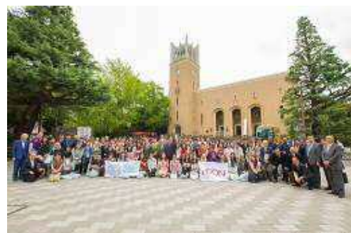
第6回ASEP開講式(早稲田大学大隈講堂)

2017年度は、「生物多様性と再生」をテーマに、王立プノンペン大学(カンボジア)、清華大学(中国)、インドネシア大学(インドネシア)、早稲田大学(日本)、高麗大学校(韓国)、マラヤ大学(マレーシア)、ベトナム国家大学ハノイ校(ベトナム)、チェラロンコン大学(タイ)の8ヶ国合計64名の学生が参加し、8月1日~6日の期間、日本で開催しました。