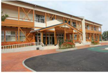
綾町中学校の校舎