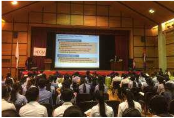
第2回生物多様性を越えて (カンボジア王立プノンペン大学)