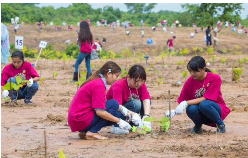
2017年 ミャンマー・ヤンゴン植樹

各国政府や地方自治体と協力し、自然災害などで荒廃した森を再生させることを目的として、日本はもとよりアジアを中心とした世界各地で植樹を行っています。2016年度は、国内では千葉県千葉市、北海道厚真町、宮城県亘理町、大分県竹田市にて、海外ではカンボジア・プノンペン、ミャンマー・ヤンゴン、中国・北京市密雲、ベトナム・ハノイにおいて植樹活動を行いました。2017年度は、国内では北海道厚真町、福島県いわき市、宮城県亘理町、大分県竹田市、千葉県千葉市、沖縄県糸満市平和祈念公園にて、海外ではカンボジア・プノンペン、ミャンマー・ヤンゴン、ベトナム・ハノイ、中国・北京市密雲において植樹活動を実施します。