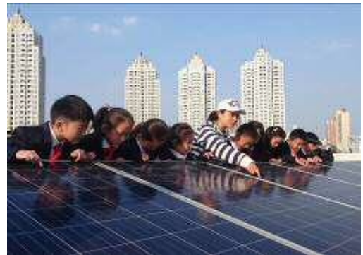
2017年太陽光発電システムの寄贈(中国・武漢)

再生可能エネルギー活用の分野では、啓発・普及、および環境教育を目的に、国内外の小中学校へ「太陽光発電システムの寄贈」を2009年から行っています。2016年度までに、日本、マレーシア、ベトナム、中国の合計40校に寄贈しました。2017年度は昨年に引き続き、中国武漢市の小中学校5校を対象に寄贈しました。